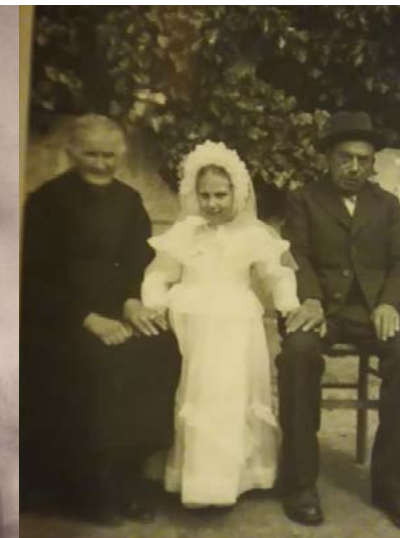
Aurora coi nonni